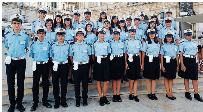
RAGAZZI MOLTO ATTENTI I minivigili dell'estate 2019

Un'attività didattico-pratica composta da più fasi: dell'«acco-