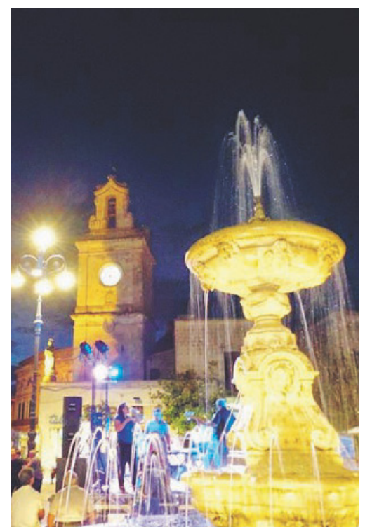
BORSE DI STUDIO A Francavilla Fontana